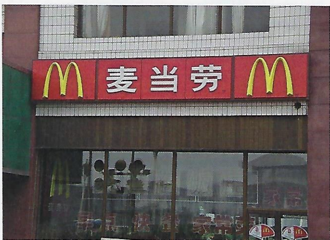
Abb. 92.1: McDonalds ist weltweit beliebt

Auch ein Global Player wie der Fast Food-Riese McDonald's begann als kleines Unternehmen in einem Stammland . Die erste McDonald's-Filiale wurde im Jahr 1940 im US-Bundesstaat Kalifornien eröffnet. Als sich der Erfolg einstellte, begann man schrittweise damit, auch ausländische Märkte zu erobern. Die Expansion begann 1967 mit dem ersten McDonald's-Restaurant in Kanada, heute wird Fast Food von McDonald's weltweit konsumiert. Dabei ist ein Wirtschaftsgigant wie McDonald's auch flexibel genug, um sich in manchen Staaten auf besondere Wünsche einzustellen. So wird für die in Österreich verkauften Burger nur heimisches Rindfleisch verwendet. Derzeit ist McDonald's in rund 100 Staaten wirtschaftlich aktiv.