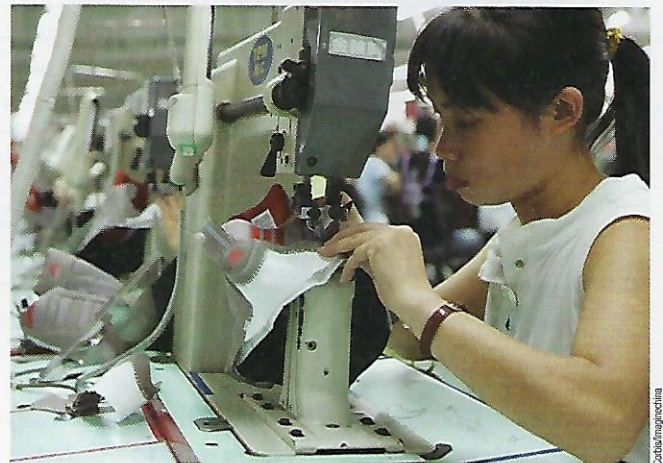
Abb. 92.2: Blick in eine Schuhfabrik in China

dung und Schuhe werden dann mit Containerschiffen in die Zielregion transportiert (vgl. Kapitel 7.6). So wie viele seiner Konkurrenten, hat auch der US-amerikanische Sportartikelhersteller Nike seine Produktion weitgehend nach Asien verlagert, v. a. nach Indonesien. Zwischen den asiatischen Schwellenländern tobt ein erbitterter Preiskampf, denn die Global Player produzieren dort, wo in kurzer Zeit die größte Stückzahl zum geringsten Preis hergestellt werden kann.